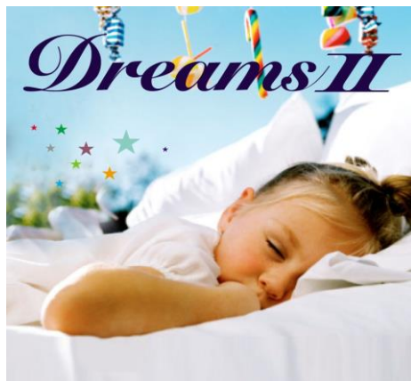
Dreams II HUCD-10043 ¥2,476(税別)

このDreamsシリーズは、海外旅行の悩みである、「機内でいかにぐっすり眠るか？」をテーマに研究・開発された商品です。