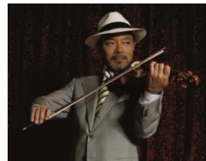
選曲・監修 ヴァイオリニスト 古澤巖

今や老若男女を問わず多くの人々の日常生活において、快眠をサポートする商品として愛聴されております。