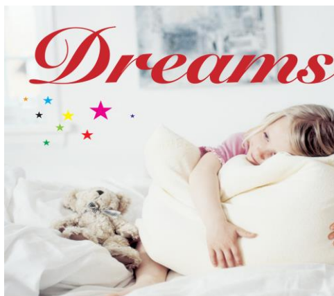
Dreams HUCD-10029 ¥2,476(税別)

"眠りを大切にするときっといい明日が訪れます" 魅力的な音楽で睡眠に入りやすい環境が整えられます。 日本を代表するアーティストが多数参加した「Dreams」シリーズ、是非お聴きください！